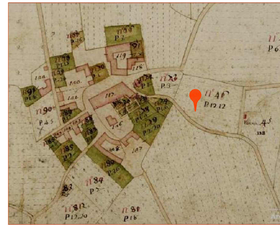
MAPPA STORICA (CATASTO TERESIANO 1721)